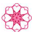
Udruženje - Association ŽENA B&H WOMAN