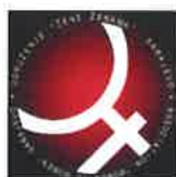
Udruženje “Žene ženama” – Sarajevo