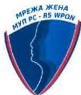
Mreža žena Ministarstva unutrašnjih poslova RS