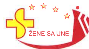
Udruženje “Žene s Une” Bihac